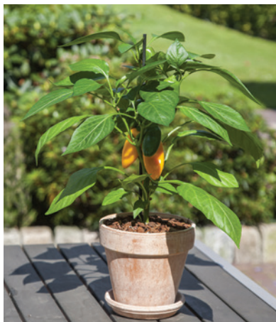
65-7191-UNT Fresh Bites F1 Jaune