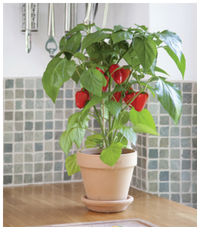
65-7190-UNT Fresh Bites F1 Rouge