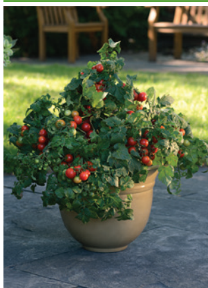
65-9251-UNT Tomate Cerise Little Bing F1 Rouge

Plant déterminé au port compact avec un feuillage vert très sain. Avec moins de 61 cm de hauteur, cette savoureuse variété produit une abondance de tomates en plein coeur de l'été. Les fleurs apparaissent tôt et les fruits mûrissent en quelques semaines seulement, permettant la récolte de nombreuses tomates à la fois. À produire au champ ou pour faire des transplants.