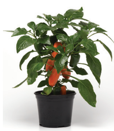
65-7192-UNT Fresh Bites F1 Orange

Nouvelle collection comportant 3 couleurs de petits piments sucrés « collation ». Ces plants très compacts produisent rapidement et offrent une récolte abondante, concentrée sur une courte période.