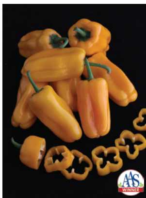
65-7296-UNT Piment Doux Just Sweet F1 Jaune

Maturité : 55 jours • Dimension du fruit (long x diam) : 8 x 3 cm